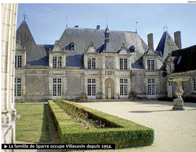
► La famille de Sparre occupe Villesavin depuis 1954.

► Pierre après pierre, tuile après tuile, ils rénovent leur château de la Renaissance ► Entre Cheverny et Chambord, une famille se bat pour restaurer Villesavin