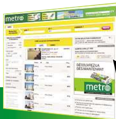
ortho... Publications Metro France